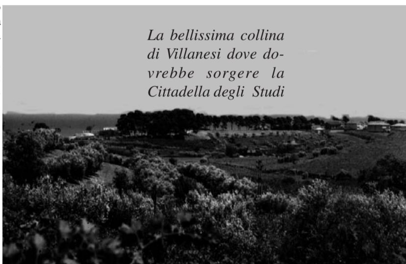
La bellissima collina di Villanesi dove dovrebbe sorgere la Cittadella degli Studi

Mi chiedo quale è il progetto di fattibilità di quest'opera? Sono stati fatti i confronti tra i vantaggi e gli svantaggi che quest'opera porterà all'intera collettività? Come mai è stata scelta proprio quella zona? Perché ad illustrare gli ar-